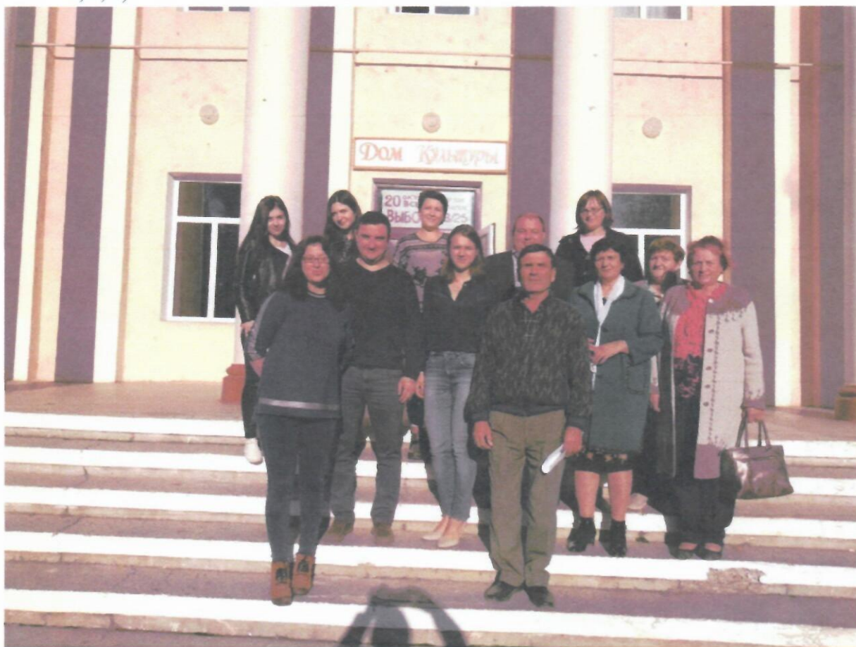
Изображение № 6 - Одна из встреч Консультативной Комиссии