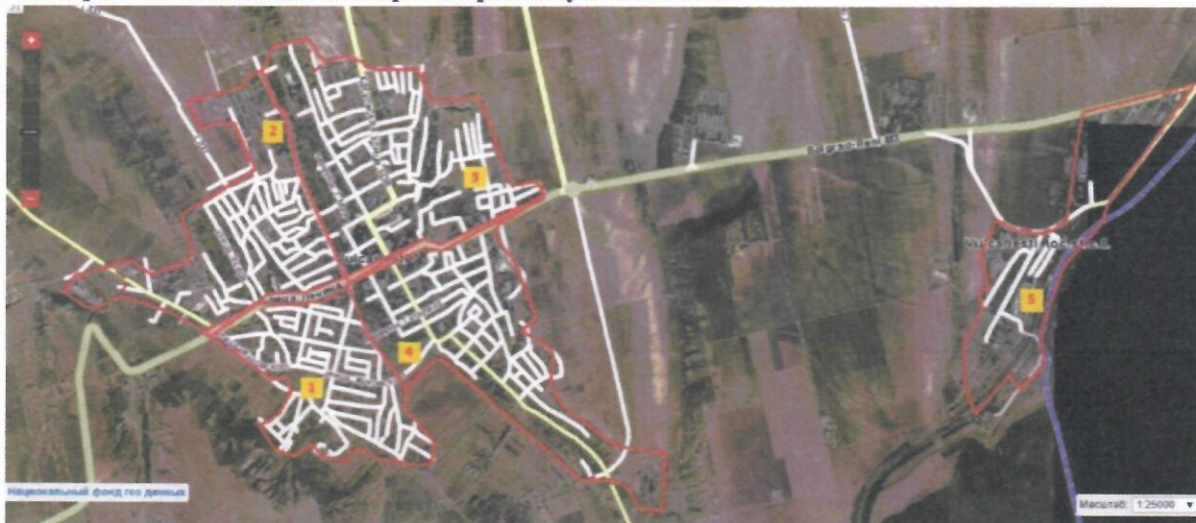
Карта № 3 - Историческое деление города по зонам, где № 1 - Зона Каварна, № 2 - Зона Стерь, № 3 - Зона Молдован, № 4 - Зона План, № 5 - Зона Станция Вулканешты