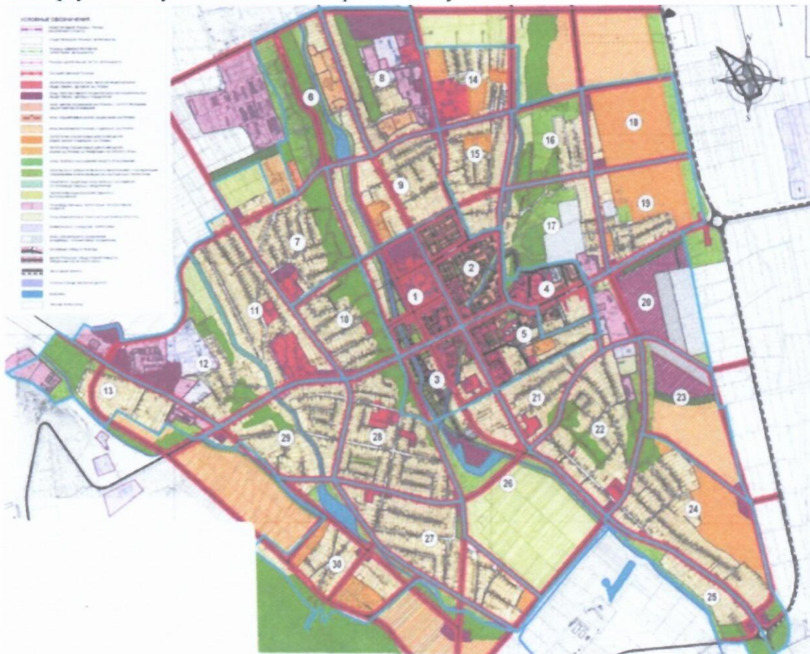
Карта № 1 - Функциональное зонирование г. Вулканешты

См. карту № 1 - Функциональное зонирование г. Вулканешты.