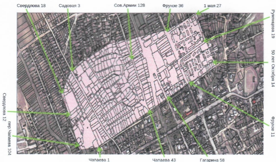
Карта 5 - Границы зоны городской Ревитализации в городе Вулканешты