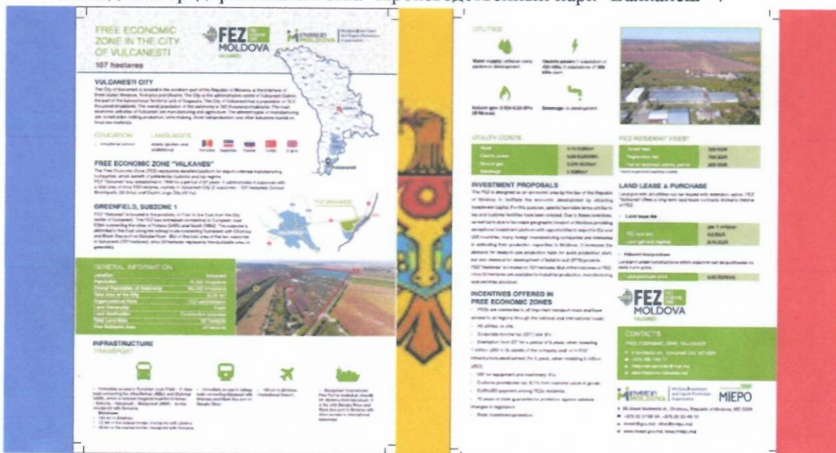
Изображение 2 - Презентация Свободной экономической зоны “Валканеш”