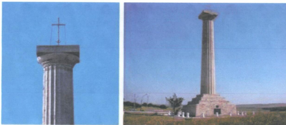
Памятник Кагульской битвы [Колонна Славы на Кагульском поле] — монумент в городе Вулканешты в Гагаузии, на юге Республики Молдова. Воздвигнут в 1848 году по проекту Ф. К. Боффо на месте победы русской армии в битве при Кагуле 1790 года — одном из главных сражений русско-турецкой войны 1768—1774.

В большинстве городов Республики Молдова, центр города содержит большую часть общественных и социальных объектов. В Зоне План находится Районная администрация, Центр семейных врачей, рынок, Теоретический лицей “Лучафэрул” с преподаванием на государственном языке, 1 недостроенная заброшенная школа, 4 аптеки, 2 банка, несколько многоэтажных домов и большое количество частных домовладений, 1 детский сад на русском языке, 1 часовня возле территории нового кладбища, автостанция, ресторан - бар Орфей, 1 автозаправка. Спецификой зоны является Большой памятник, памятник Кагульской битве, воздвигнутый в 1848 году. Над Буджакской степью высится монумент - символ победы - почти 22-метровая колонна на пьедестале, увенчанная капителью с чугунным крестом и полумесяцем.