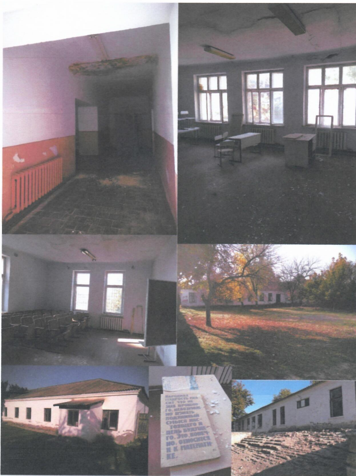
Изображение № 3 - Гимназия № 4, город Вулканешты