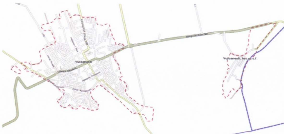
Карта № 2 - Город Вулканешты и Железнодорожная станция Вулканешты

В ходе обсуждения Программы Городской Ревитализации, было решено включить в исследование и сектор Станции Вулканешты (железнодорожную станцию), так как Станция Вулканешты является неотъемлемой частью города Вулканешты и находится в 6 (шести) километрах от города, так как здесь проложена железнодорожная станция. См. Карту № 2 - Город Вулканешты и Железнодорожная станция Вулканешты.