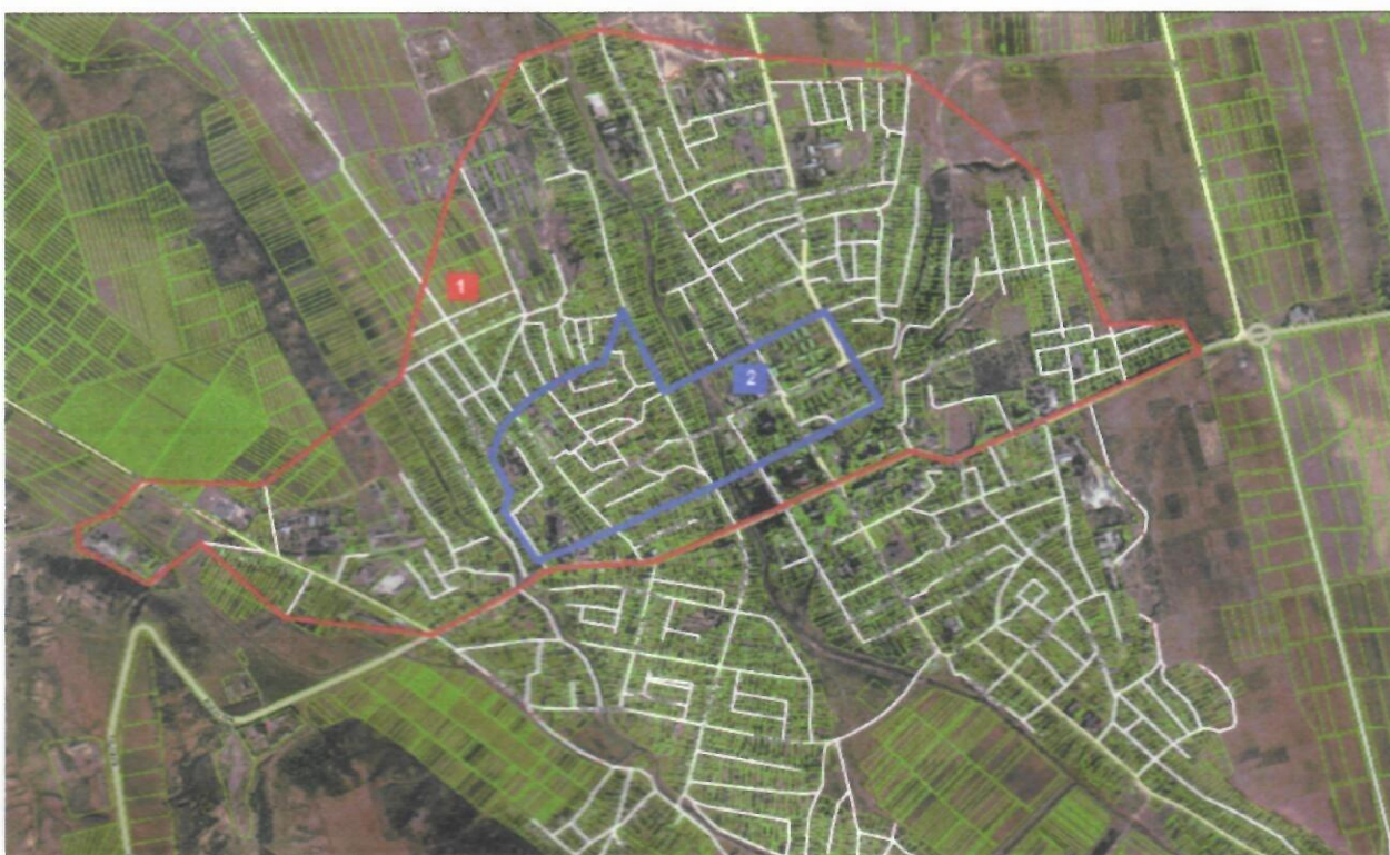
Карта № 4 - Наиболее уязвимая зона Молдован-Стерь (красное подчеркивание № 1) и Зона Городской Ревитализации города Вулканешты (синее подчеркивание № 2).