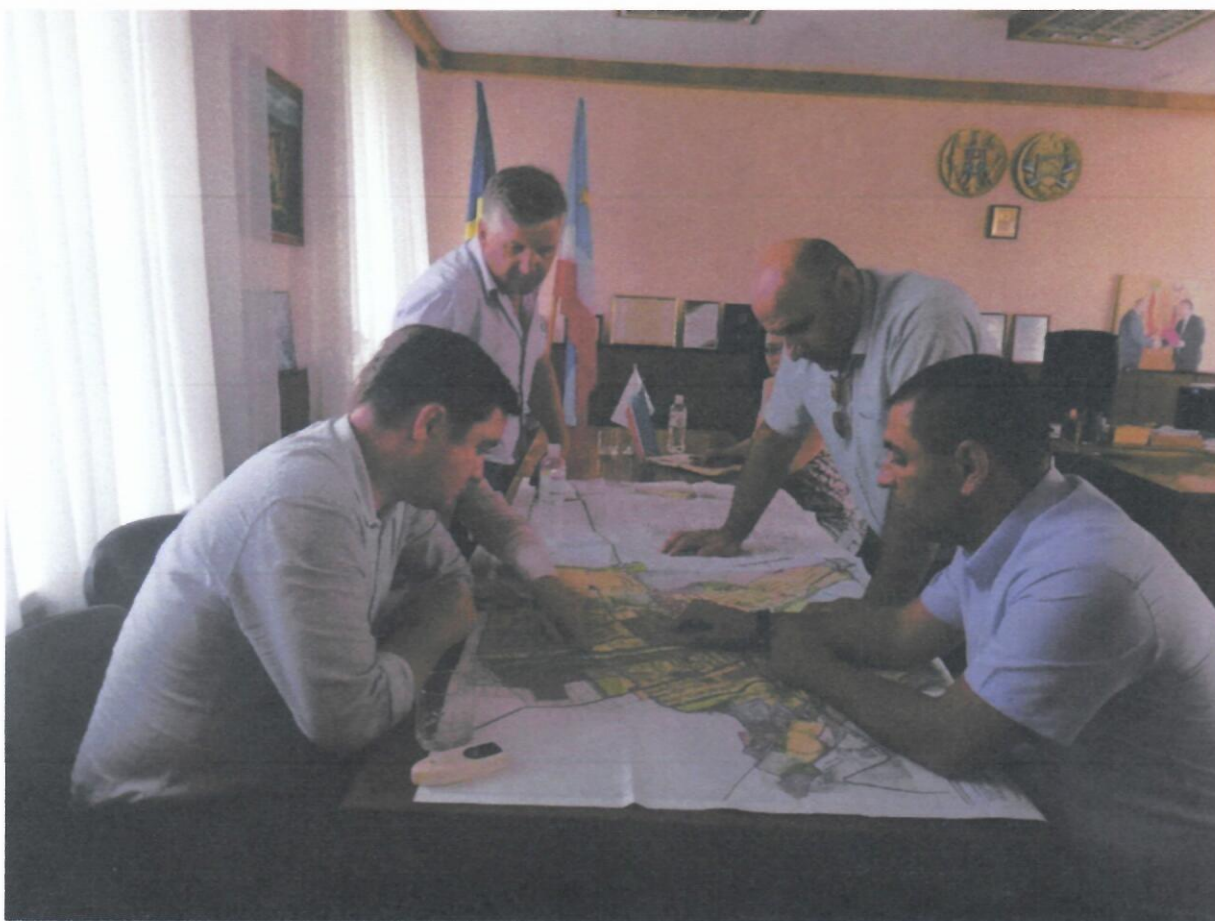
Изображение № 4 - Исследование Генерального плана города Вулканешты, Координационный Комитет в частичном составе