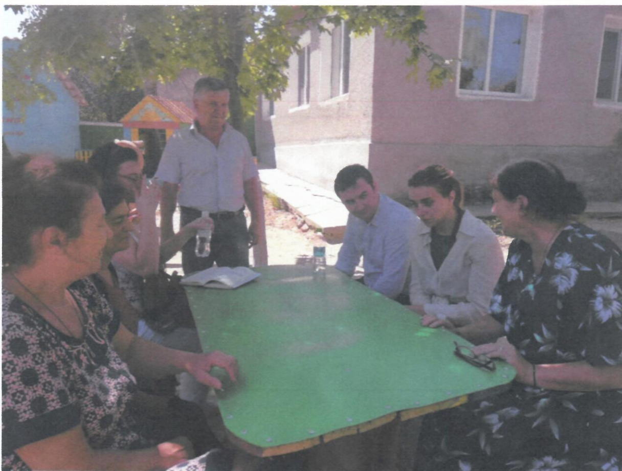
Изображение № 5 - Выезд в деградированные зоны, Детский Сад № 4, г.Вулканешты